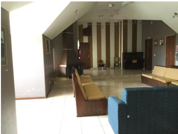
Sala da Família

Na área superior possui mais três apartamentos e uma sala de eventos chamada: sala da família.