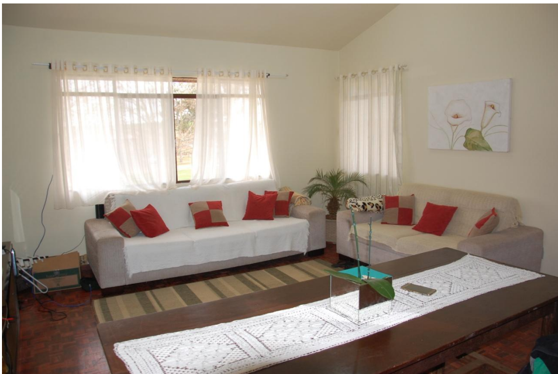
Sala/copa Apartamento 1

O primeiro apartamento contém 03 quartos, 01 copa, ligados com a sala, cozinha, 02 banheiros.