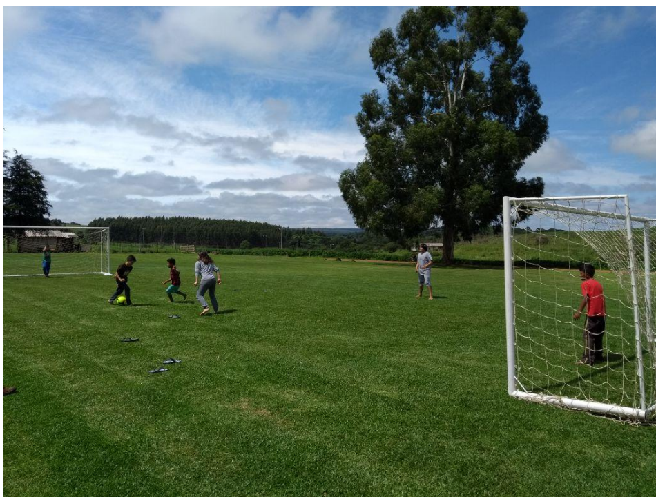
Campo de futebol