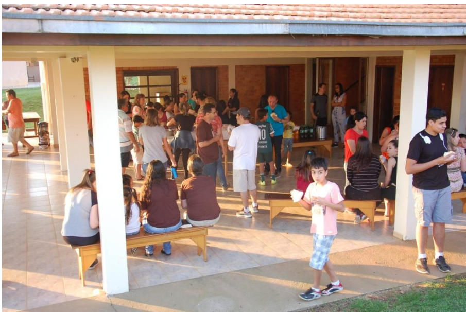
Feriado com participação de igrejas da comunidade