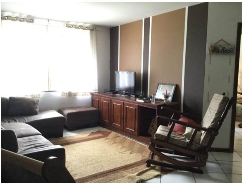
Sala Apartamento 3

O terceiro apartamento contém 06 quartos, 02 banheiros, 01 cozinha com copa, 01 sala.