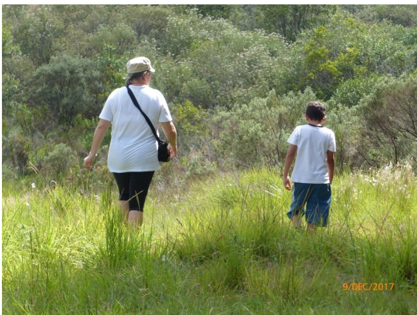
Caminhada no mato